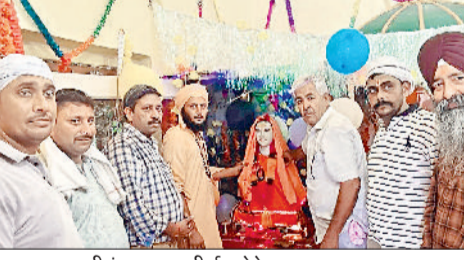
बराड़ा। बाबा श्रीचंद का आशीर्वाद लेते हुए श्रद्धालु।

पूजा-अरदास कर समाज के जनकल्याण की कामना की