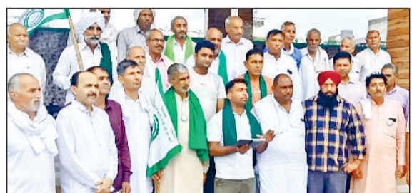
पंजाब में बाढ़ पीड़ितों की मदद के लिए चंदा एकत्र करते हुए भाकियू के पदाधिकारीगण।