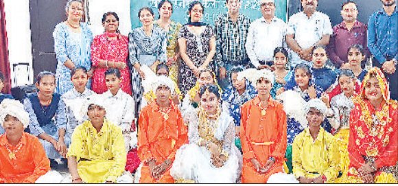
इंदी। खंड स्तरीय कला उत्सव में विद्यार्थियों के साथ अध्यापक।