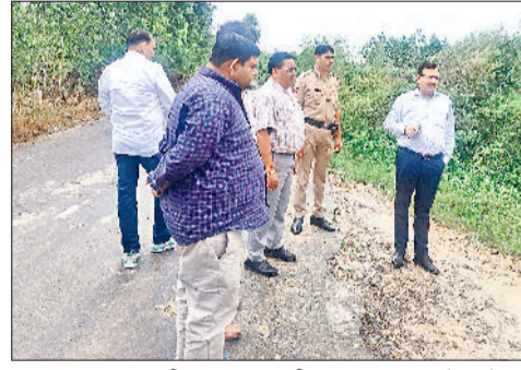
मुलाना। मारकंडा नदी का दृश्य व नदी का मुआयना करने पहुंचे एसडीएम

पहाड़ों में हुई मूसलाधार बारिश से मारकंडा नदी का सोमवार को रौद्र देखने को मिला। इस सीजन में तीसरी बार मारकंडा नदी ने खतरे के निशान 10 फीट को पार किया। सुबह से ही उफान पर बह रही मारकंडा नदी दोपहर करीब 2 बजे 10. 9 फीट पर 54437 क्यूबिक के रिकॉर्ड जलस्तर पर जा पहुंची। इससे मारकंडा नदी अपने रास्ते से आवरणफले होकर खेतों के अंदर बहने लगी। कई एकड़ फसल पर खराब होने का खतरा मंडराने लगा है। शाम 5 बजे मारकंडा नदी का जलस्तर घटकर 9.4 फीट करीब 45566 क्यूबिक पर दर्ज किया गया। सुबह से लेकर शाम तक मारकंडा नदी भारी उफान पर बह रही थी।