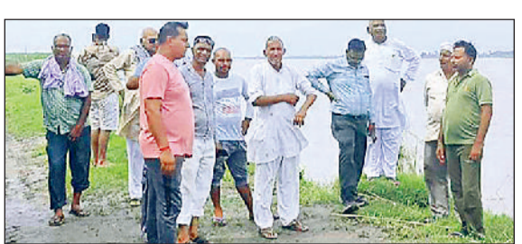
यमुना नदी पर डेरा डाले खड़े गांव हथवाला के किसान

गांवों के ग्रामीणों की चिंता बढ़ गई है। निचले इलाके में लोगों को सुरक्षित स्थानों पर जाने की सलाह दी जा रही है। यमुना जल स्तर बढ़ जाने के कारण फसलें जलमग्न हो गई हैं। यमुना के रिग बांध पर कड़ी नजर जिला परिषद की मुख्य कार्यकारी अधिकारी (सीईओ) डॉ.