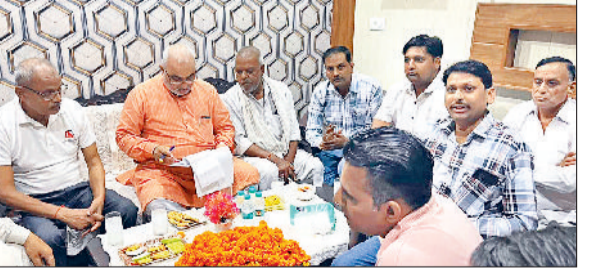
करनाल। गांव जरीफाबाद और पंडरक लोगों की समस्याएं सुनते विधायक।