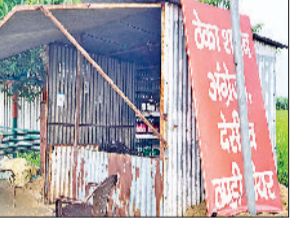
हरिभूमि न्यूज़ पिहोवा

मंडियों में खरीद प्रबंधों को दुरुस्त करने के लिए अधिकारियों को निर्देश दिए