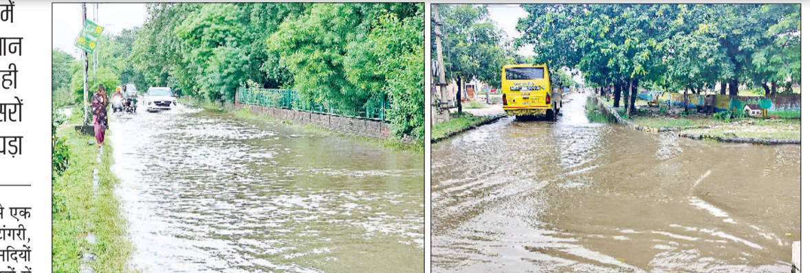
अंबाला। ट्विन सिटी में जलभराव का दृश्य।

ट्विन सिटी की रिहायशी कॉलोनियों में भी जलभराव