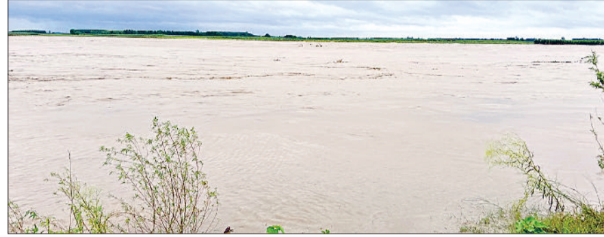
इंदी के पास से गुजर रही यमुना नदी उफान पर।

पहाड़ों में हो रही लगातार बारिश के चलते हथिनी कुंड बैराज से सोमवार को तीन लाख उनतीस हजार क्यूसिक पानी छोड़े जाने इंद्र की दर्जनों गांवों से होकर गुजर रही यमुना नदी में पानी पूरे उफान पर है। जिसके चलते यमुना नदी के साथ लगते गांवों में बाढ़ की स्थिति पैदा हो गई है। नदी का पानी तटबंधों को छू रहा है और यमुना में ज्यादा पानी आने पर पानी गांवों में भी घुस सकता है। गौरतलब है कि पहाड़ों हो रही तेज बारिश के कारण सोमवार सुबह 9 बजे हथिनी कुंड बैराज से तीन लाख उनतीस हजार क्यूसिक पानी छोड़े जाने से बाढ़ का अंदेशा ग्रामीणों के लिए चिंता का विषय बना हुआ है। यमुना नदी से सटे इंद्र की दर्जनों गांवों नवियाबाद, जपती छपरा, सैयद छपरा, मुंसपुर, समसपुर, कलसौरा, नगली, डरा हलवावा न गढ़पुर जयपुर आदि में बाढ़ का खतरा बना हुआ है। पानी को लेकर