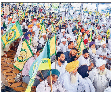
हरिभूमि न्यूज़ कुरुक्षेत्र

हरियाणा किसान-मजदूर संघर्ष मोर्चा के आह्वान पर धान में फौजी वायरस से हुए नुकसान की भरपाई करने व धान की सरकारी खरीद 15 सितंबर से शुरू करने सहित अन्य मांगों को लेकर सोमवार को कुरुक्षेत्र में सेक्टर 3 स्थित मुख्यालय आवास का घेराव करने जा रहे प्रदेश भर के किसानों को पुलिस प्रशासन ने सीएम आवास से 500 मीटर पहले बैरिकेड्स लगाकर रोक दिया। इसके बाद किसानों के प्रतिनिधिमंडल ने सीएम