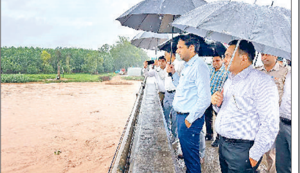
अंबाला। घग्गर नदी का मुआयना करते डीसी व अन्य अधिकारी।