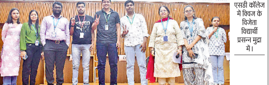
एसडी कॉलेज में विजय के विजेता विद्यार्थी प्रसन्न मुद्रा में।